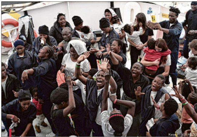
Sur l' Aquarius , on s'est réjoui à l'annonce de l'approche des côtes espagnoles.

Les premiers des 630 migrants secourus par l' Aquarius au large de la Libye étaient attendus ce dimanche matin vers 6h au port espagnol de Valence, après une semaine de transport en Méditerranée. L' Aquarius et les deux navires militaires italiens qui les acheminent naviguaient la nuit dernière dans les eaux espagnoles. Le gouvernement de la région de Valence avait dans un premier temps annoncé hier matin que la flottille arriverait vers midi, mais le sous-directeur général des urgences du gouvernement régional, Jorge Suarez, a ensuite indiqué à la presse et sur Twitter que les arrivées des bateaux s'échelonnaient à