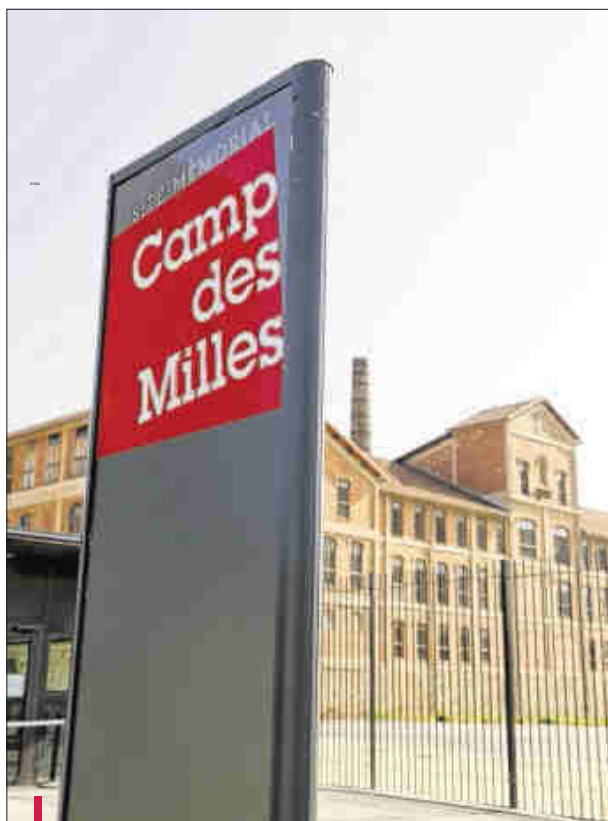
Le camp des Milles est situé dans le quartier éponyme, à quelques kilomètres d'Aix-en-Provence.

un hommage aux activités culturelles de cette époque, lorsque les détenus avaient organisé un cabaret dans l'un des fours à tuiles du bâtiment. Pour montrer que, eux aussi, bien qu'enfermés, menaient une lutte politique."