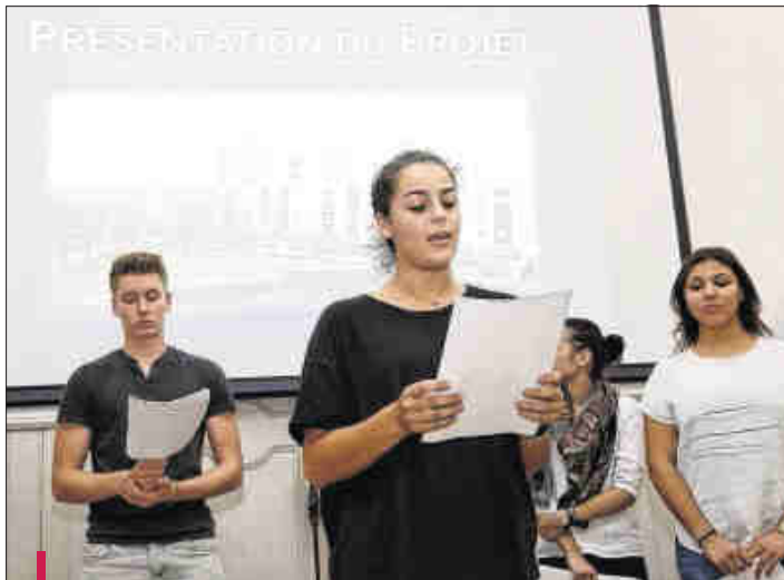
Le 1 er octobre 2015, les élèves du lycée Célonny restituaient leurs travaux effectués dans le cadre du projet "La Shoah comme objet d'histoire et de mémoire".