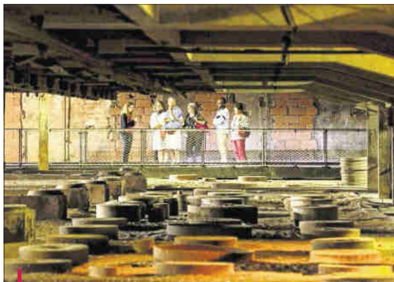
Depuis maintenant trois ans, le camp d'internement des Milles est ouvert au public.